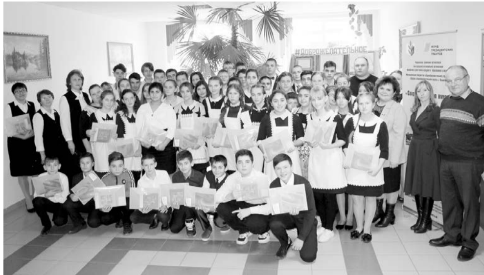
Участники проекта - учителя и ученики Ольшанской школы, родители, представители общественности

Экспозиции музея включают несколько тематических направлений: «История родного края», «Культура и быт», «Археология», «Нумизматика», «Летопись образования села Ольшанка», «Трудовая доблесть ольшанцев», «Великая Отечественная война», «Уголок православия». На средства гранта приобретено специальное оборудование, с помощью которого оцифровано более 100 экспонатов, создан виртуальный тур по школьному музею средней школы села Ольшанка.